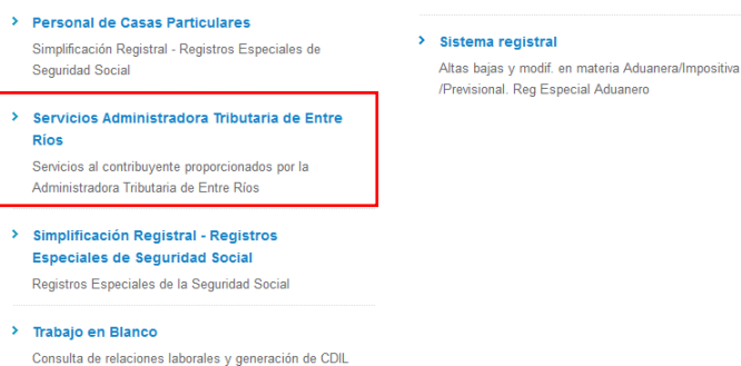
Sitio web AFIP – Servicios habilitados

Una vez que haya ingresado en el sitio de AFIP aparecerá un menú con todos los Servicios habilitados para el contribuyente, en dicho menú se deberá elegir Servicios Administradora Tributaria Entre Ríos .