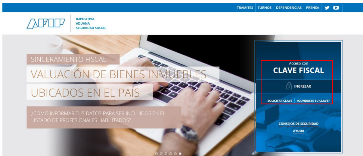
Sitio web AFIP – Ingreso con Clave Fiscal

El ingreso a la aplicación de Agentes de Sellos se realiza mediante el acceso con clave fiscal desde el sitio de AFIP ( www.afip.gov.ar )